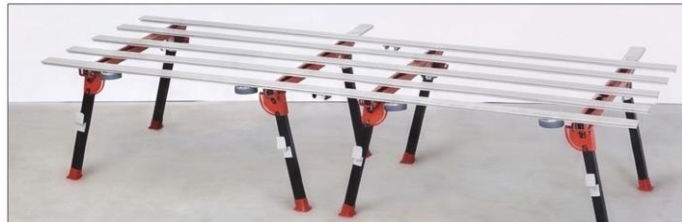
2 *BIGFOOT XL" extension area of lavoro: 340x125 mm