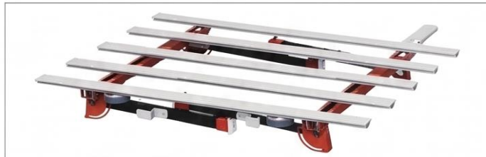
**BIGFOOT XL" con gambe piegherabili